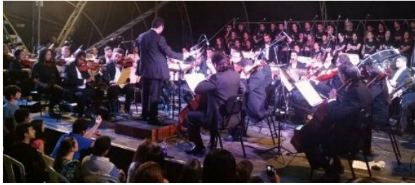
Concerto Campus Arapiraca, Bosque das Arapiracas – 09/10