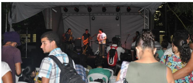
Dia 06/05 – Som do Beco