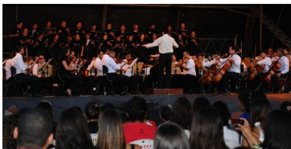
Concerto Campus Sertão, Delmiro Gouveia – 09/10