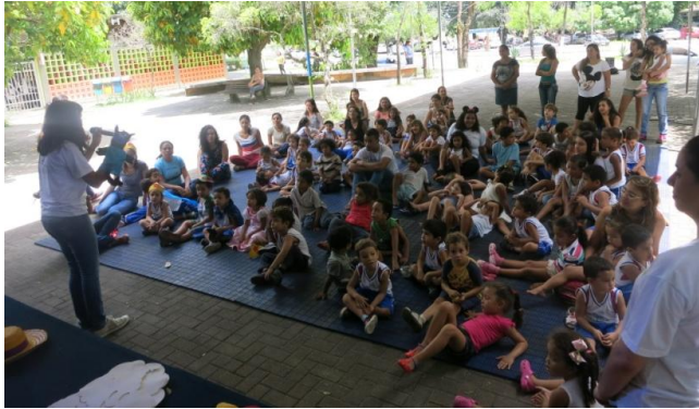
Dia 14/10 – Biblioencanta