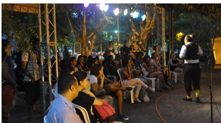
Dia 27/05 – Cenas Clownssicas