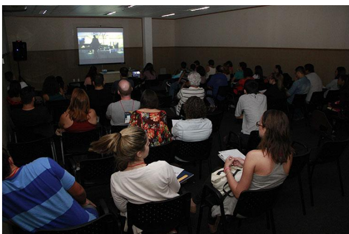
Cineclub Nu Olho