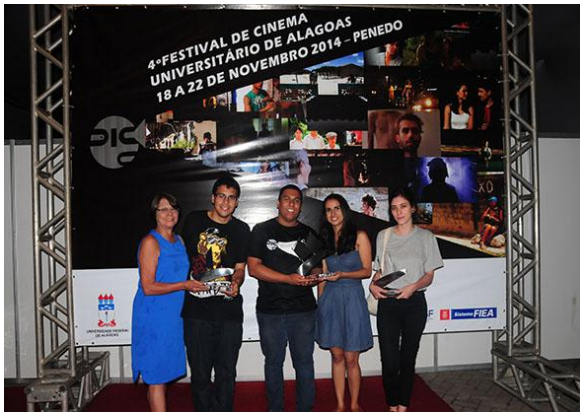
Vencedores da Mostra Competitiva