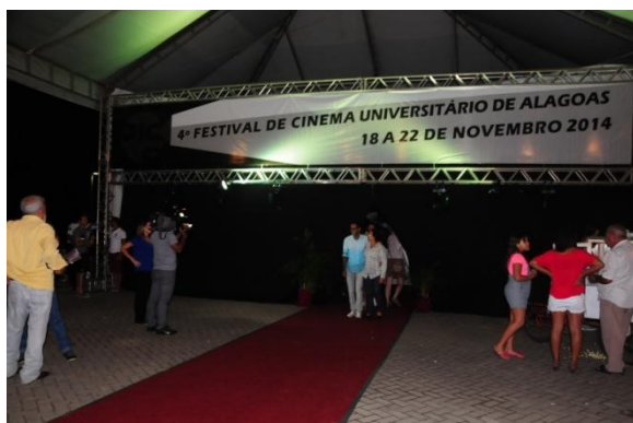
Entrada da Tenda de Apresentações de Cinema