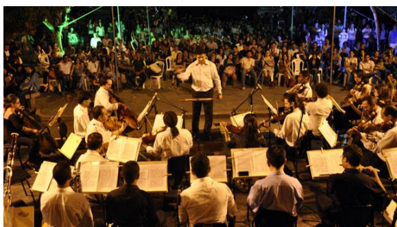
Concerto Campus A. C. Simões, Maceió – 18/09