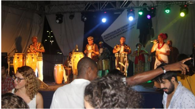
Apresentação Artística – Orquestra de Tambores