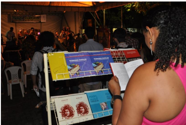
Dia 05/08 – Afoxe Povo de Exu e Stand de Vendas Edufal