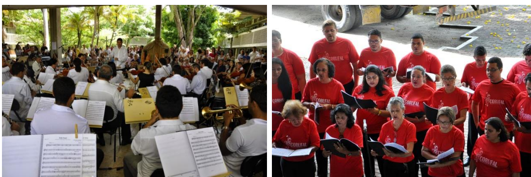
Dia 15/12 – Concerto de Natal: abertura das festividades na Ufal