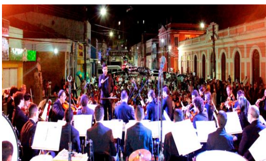
Concerto Penedo – 09/10