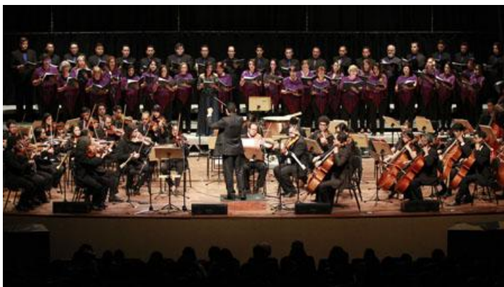
Quinta Sinfônica 21/08 – Teatro Gustavo Leite – Orquestra e Coro no CAIITE