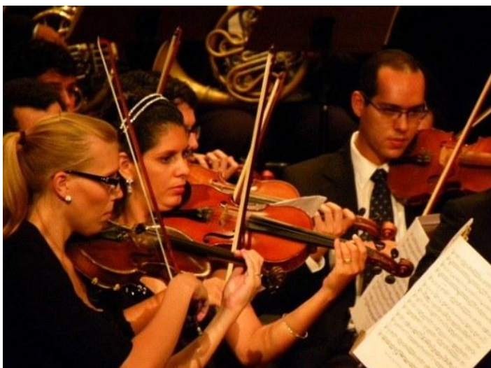
Quinta Sinfônica 27/11 – Teatro Deodoro – Concertino para Violino e Orquestra de Câmara