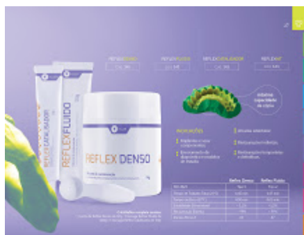
ITEM 24 - SDK COMÉRCIO.jpg 708K